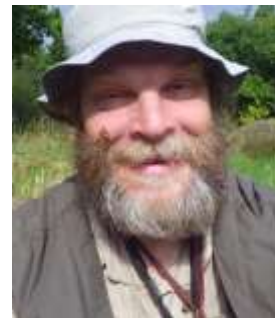
Ordförande Björn Ström

Verksamheten på Naturcentrum där våra programlagda verksamhet är en del kommer att få en ny och vidgad inriktning sedan förra personalen slutat under hösten. Förhoppningsvis kommer en satsning på en bredare inriktning under våren.