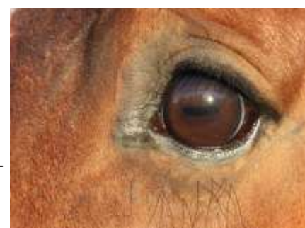
Syner är en fantastisk förmåga som livet utvecklat.

gor, se och tolka ljusbilder, överleva lång tid i torka och stark kyla, minnas för att bättre kunna hantera kommande situationer, att ge signaler till andra individer och samspråka; att samverka med andra arter i komplexa ekologiska system. Och oerhört mycket mer. Forskning förstår ännu inte fullt ut