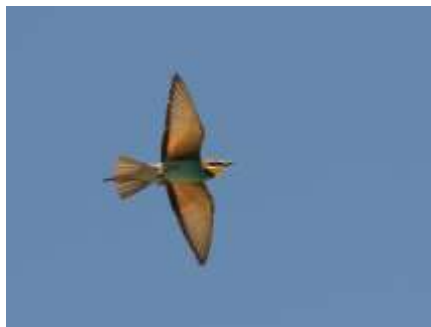
Biätare fångar flygande insekter.