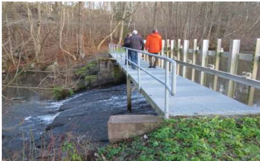
Ett av många vandringshinder i Stångån

ål (utsätts) och en mängd fiskar av många arter som blir mat åt fisk-