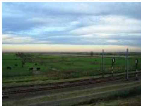
Vy över Oostvaardersplassen

”I STORT SETT ALL MARK ÄR ÅKER ELLER BEBYGGD MARK FÖRUTOM EN DEL SMÄRRE YTOR SOM HAR FÅTT VÄXA IGEN TILL SKOG”