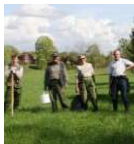
Uppsättning av rovdjurs- stängsel

Runt millennieskiftet sattes ett antal rovdjurssäkra elstängsel upp runt fårbesättningar i Östergötland, men vargarna dröjde och Jordbruksverket slutade tilldela Östergötland och Småland medel för rovdjursstängsel. Så när en varg började riva får på Vikbolandet och en i Kronobergs län var bristen på stängsel och stängslingsbidrag plågsam, men reglerna ändrades och nu finns en pott på länsstyrelsen att ansöka från.