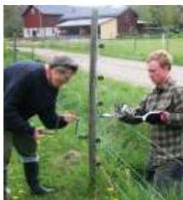
Montering av isolatorer vid stängslingsarbete