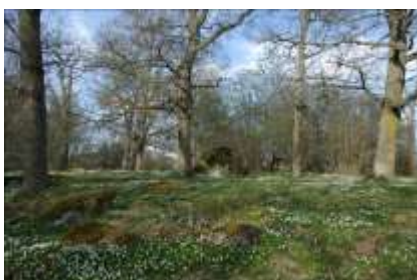
Vinnarbild i 2011 års fototävling Värbild från Tinnerö Eklandskap