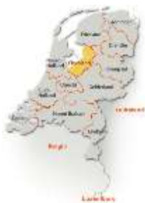
Flevolands placering i Holland