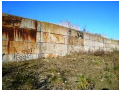
Mur med häckningshål för backsvala