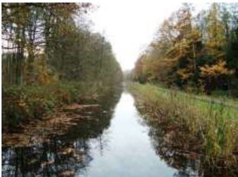
Kanal med kungsfiskare

Många ekologer anser att stora betesdjur då satte sin prägel på landskapet och skapade ett halvöppet landskap i stil med vårt eklandskap. Ett problem med Ostvaardersplassen är att boskapsdjuren får föröka sig utan att det förekommer någon jakt eller stora rovdjur. Det enda man gör är att avliva sjuka djur som lider. Området är idag välbetat och träd och buskar i stort sett borta eller tynande.