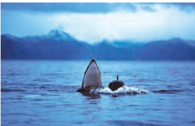
Fotograf Sara Wennerqvist

Wennerqvist inledde föredraget med att berätta att hon redan som 15-åring bestämt sig för att aldrig ha ett tråkigt jobb och att bli naturfotograf. Sannerligen har hon lyckats, och detta var ett tillfälle när ett antal östgötska naturentusiaster fick möjligheten att ta del av hennes inspiration och engagemang! Sällskapet fick se bilder från späckhuggarsafari utanför Narvik, valinventering i Norska havet, vitvalar vid norsk-/ryska gränsen, isbjörnar på Svalbard och valupplevelser vid Azorerna.