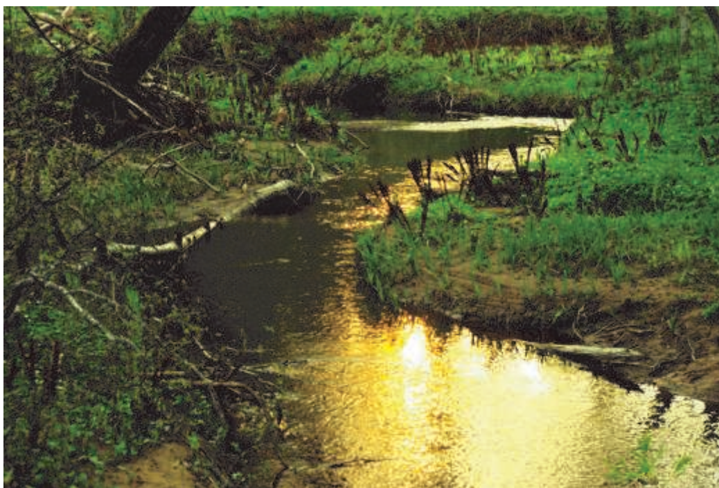
Vinnarbild: Kväll vid Stjärnorpsravinen, Foto: Carin Gondesen