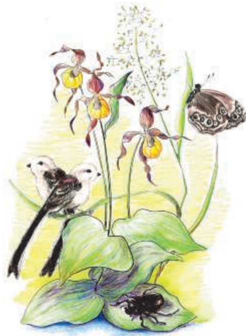
Teckning Frida Lögdberg